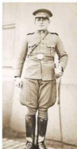
Vistiendo el uniforme de Carabineros.

Recuerdo que, cuando niña me decía que no estaba del todo contento con el ambiente del Seminario. Los Franciscanos eran muy estrictos con los ayunos de alimentos y bebidas, lo que se distanciaba enormemente de la dieta que siempre había tenido en Chiloé, donde la comida abundante es parte de la vida de los isleños.