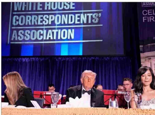
TRUMP ESTABA en la cena de corresponsales de la Casa Blanca cuando ocurrió todo.

El FBI dijo que habían capturado a un sospechoso tras lo que describió como "un incidente de tiroteo". Trump también informó que el sospechoso fue captu-