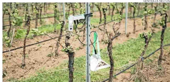
Con dispositivos alimentados con energía solar y que funcionan con IA, Neltume monitorea plagas y cultivos en terreno.