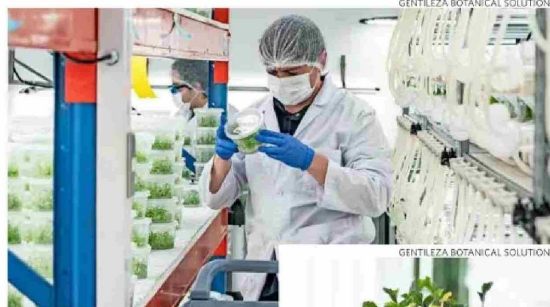
Un biofungicida de amplio espectro creó Botanical Solutions.

En el caso de Botanicals Solutions, explica Ibáñez, el crecimiento inicial estuvo impulsado principalmente por inversionistas de capital de riesgo, especialmente fondos