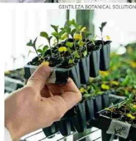
Desde 2018 es parte del portafolio de Syngenta.

Aun así, los expertos coinciden en que la mirada hacia las empresas de innovación agrícola está cambiando a nivel mundial. Un ejemplo de ello es el interés que están mostrando actores como Y Combinator, la aceleradora de startups tecnológicas más prestigiosa e influyente del mundo, y Palantir Technologies, empresa de software estadounidense especializada en inteligencia artificial, big data y análisis de defensa, que hoy buscan generar alianzas con empresas agtech .