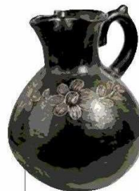
Una serie de jarros y las clásicas guitarreras de greda negra destacan en su colección.