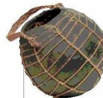
Vasija de cestería recubierta en cera para contener agua (Paraguay).

El Sello de Excelencia a la Artesanía se debe al impulso de Tita, quien primero importó la iniciativa desde la Unesco para los países del Cono Sur, y en 2008, en conjunto con el Consejo de la Cultura, implementó el reconocimiento en Chile.