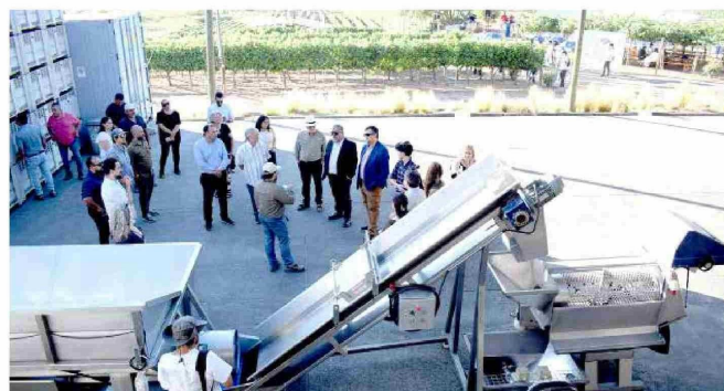
Asimismo, se pudo conocer las maquinarias y posteriormente entrar a las bodegas donde se conserva lo extraído de los viñedos.