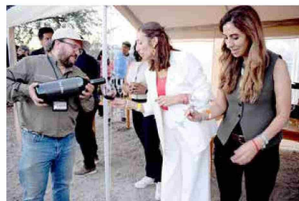
Finalmente, para concluir el evento, los asistentes fueron invitados a hacer un brindis con un nuevo vino ensamblaje llamado Por Fin, sellando con esto, la primera actividad en torno al PTI "Enoturismo Sustentable en la Región del Maule".