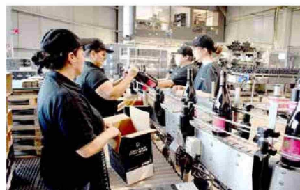
Luego se hizo un recorrido por la sala de producción, donde se realiza el envasado, etiquetado y embalaje de los productos.

● Iniciativa fue lanzada en Viña Invina, donde tras explicar los alcances del programa, se hizo un tour por los viñedos, las bodegas y la sala de producción, para luego hacer un maridaje al atardecer, posteriormente, firmar un compromiso de gobernanza y finalizar con un brindis, con el vino de ensamblaje "Por fin".