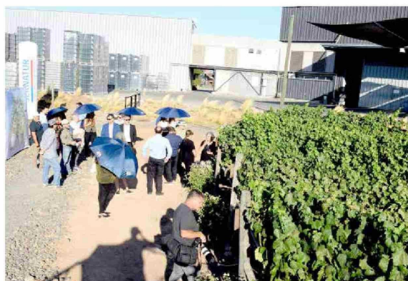
Luego del lanzamiento del PTI, se realizó un tour por la Viña, donde los asistentes pudieron conocer los viñedos y las 15 cepas que se trabajan en el lugar.

Finalmente, el alcalde de San Rafael manifestó que "nos llena de ilusión esta iniciativa en donde una actividad productiva tan relevante en el Región del Maule, como es el mundo del vino es relevada y se le entrega la importancia que tiene. Creo que en momentos donde el escenario se torna complejo, la asociatividad y la coordinación entre el mundo público y privado puede marcar la diferencia".