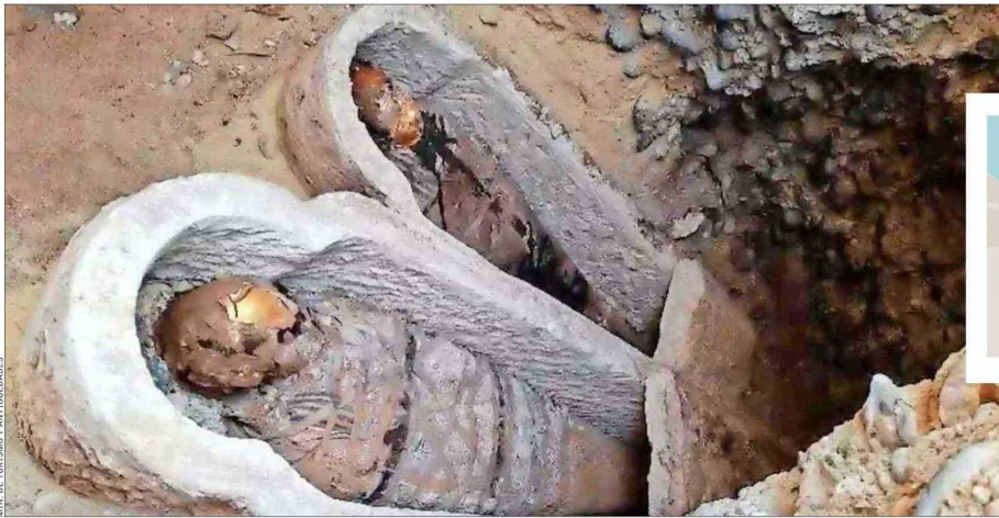
MIN. DE TURISMO Y ANTIGÜEDADES

"En Oxirrincó los papiros —siempre con textos en griego— se hallan sobre los individuos momificados de época romana, y por lo general, están sellados con un sello de limo. Los textos tienen carácter mágico y