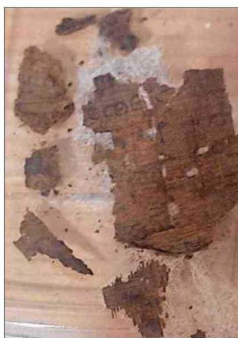
U. DE BARCELONA

El papiro está en una etapa de conservación y análisis. Si bien la noticia se dio a conocer a los medios, aún no se ha escrito el reporte científico de la investigación.