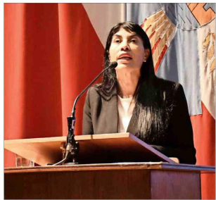
Mientras los estudiantes protestaban afuera del Aula Magna, Lincolao daba una charla sobre el rol del ministerio y el auge de la inteligencia artificial.

Actores del mundo educativo alertan sobre las consecuencias de la escalada de incidentes de las últimas semanas. La Moneda presentará una querrela por atentado contra la autoridad.