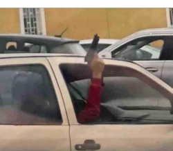
Los detenidos por este caso pasarán a control de detención hoy. En la imagen, uno de los imputados con el arma.

El coronel de Carabineros, Luis Muñoz, prefecto de Antofagasta, detalló que personal del Gope acudió al campus luego que personal de seguridad del plantel denunció que en uno de los estacionamientos, dos personas manipulaban un arma de fuego. "Personal de Carabineros concurre rápidamente al lugar, aplica el protocolo correspondiente y procede a la detención de dos personas que manipulaban un arma, que resultó ser a balines. Esta utiliza aire comprimido". "Estas personas exhibieron el arma al público, por lo cual fueron detenidas por el delito de amenazas y además causaron la conmoción pública", añadió. Este caso policial generó impacto, más aun luego del homicidio de una inspectora (59) del Colegio Instituto Obispo Silva Lezaeta en Calama (200 km al norte), perpetrado por un alumno del establecimiento (18) el 27 de marzo pasado.