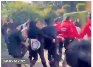
IMAGEN DE VIDEO

Escollada por su equipo y guardias de la UACh, la ministra sale corriendo. Magna a eso de las 14:45 horas. En el trayecto a su auto fue rodeada y agredida con empujones e insultos y el lanzamiento de líquido.