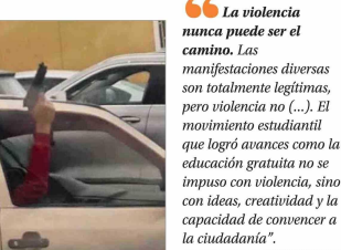
Los detenidos por este caso pasarán a control de detención hoy. En la imagen, uno de los imputados con el arma.