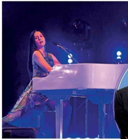
© Cerca de dos mil personas disfrutaron de una jornada cultural con el cierre musical de Francisca Valenzuela .