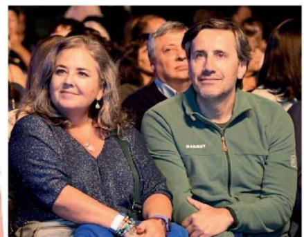
© Paola Muñoz y Alberto Kresse , presidente del directorio de Acades.