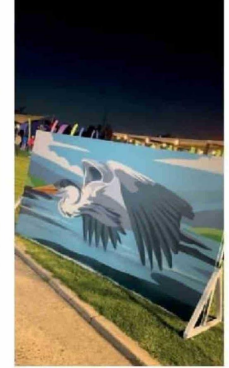
© Los asistentes y la Fundación Mapocho Vivo retrataron un mural con la garza cuca, una de las especies que regresaron al río.