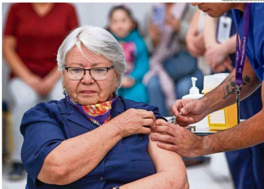
MEDIDA INCLUYE ADULTOS MAYORES, ENFERMOS CRÓNICOS Y CUIDADORES DE ADULTOS MAYORES EN ELEAM.

nicos pueden recibir la vacuna desde los 6 meses hasta los 59 años (anteriormente, estaba fijado para mayores de 18).