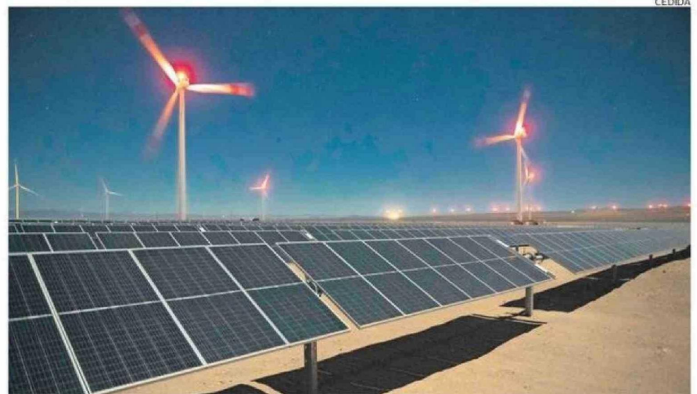
EL SECTOR ENERGÉTICO ES UNO DE LOS MÁS RELEVANTES EN LA REGIÓN.

Asimismo, relevó el dinamismo reciente del sistema de evaluación ambiental, pues "solo en el primer mes de gobierno ingresaron a evaluación más de 17 mil millones de dólares, lo que es una cifra histórica. Evaluaremos en conjunto la forma de potenciar al equipo local del SEA con el fin de cumplir con la agilización de plazos ante la importante responsabilidad que tenemos como institución".