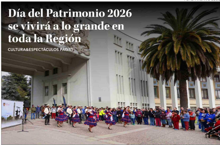
Día del Patrimonio 2026 se vivirá a lo grande en toda la Región