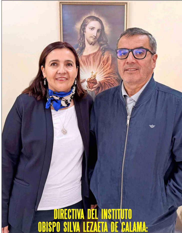
DIRECTIVA DEL INSTITUTO OBISPO SILVA LEZAETA DE CALAMA: