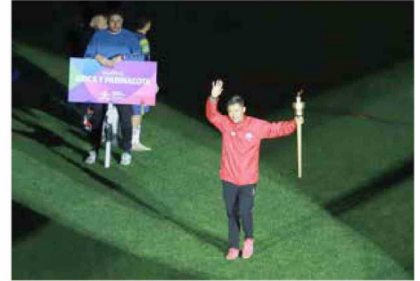
El evento se retomó durante 2024 en La Araucanía y este 2026 se realizaría su sexta edición.

Para las competencias de este año se contemplaba la participación de más de 3.000 deportistas nacionales en 22 disciplinas, de las cuales 16 eran convencionales y seis paralímpicas.