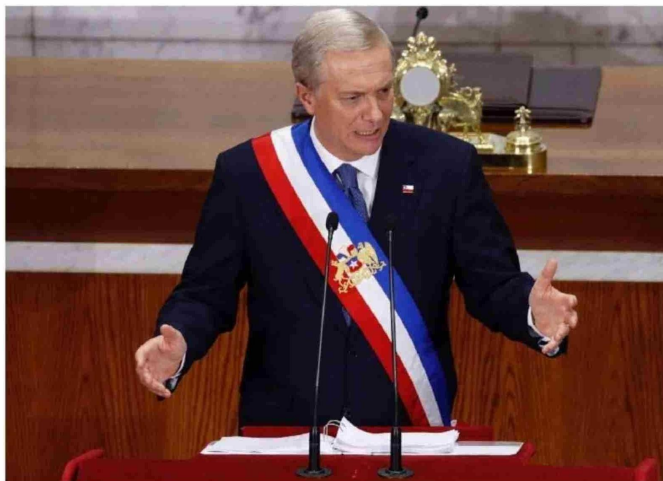
► En Vivienda el Mandatario indicó que se ampliarán los planes habitacionales.