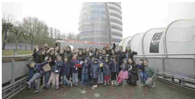
EL PRINCIPAL HITO FUE LA VISITA AL CENTRO ESPACIAL NACIONAL DE LEICESTER, ADÉMÁS DE CONOCER LONDRES.