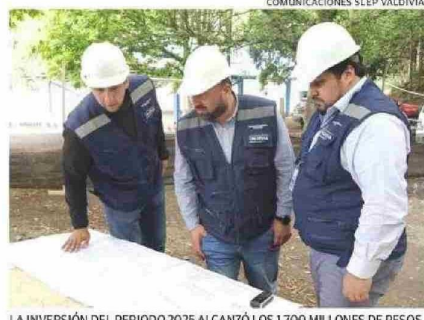
COMUNICACIONES SLEP VALDIVIA.

tos de la provincia de Valdivia pertenecientes al Servicio Local. Para ello, la inversión ejecutada durante el periodo, desde enero hasta la primera semana de diciembre, para la atención de los distintos requerimientos solicitados por los establecimientos educativos, asciende a un monto aproximado de $1.700 millones. <3