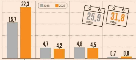
DÍAS DE AUSENTISMO PROMEDIO SEGÚN TIPO DE LICENCIA NÚMERO DE DÍAS