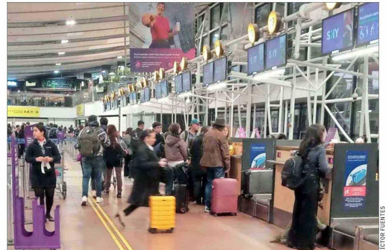
JORNADA MATUTINA. — Desde la madrugada de ayer, el terminal nacional reunía a quienes aprovecharon de viajar en la víspera de Semana Santa a otras regiones.

comentaba que estaban al tanto de la situación de las bandadas de aves y relata que es un problema que también afecta al terminal aéreo de Mataverí. Este, según detalla, suele enfrentar