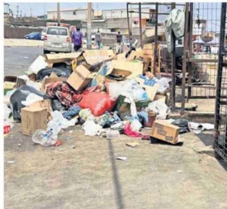
LA ACUMULACIÓN DE BASURA AFECTA AL SECTOR.

permisos, otras personas les han quitado los permisos y no han vuelto a darles. También, como ha subido de precio, ellos tienen que pagar impuestos y son más caro. Ha afectado