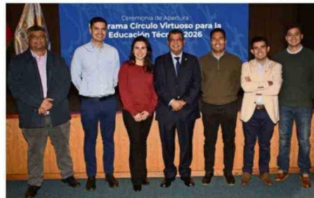
Equipo de Codelco División Ventanas.