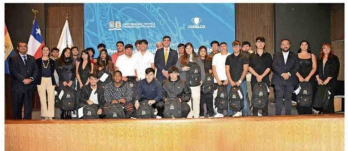
La ceremonia se realizó en las dependencias de la Casa Central de la Universidad Santa María, en Valparaíso.