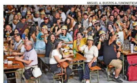
MIGUEL A. BUSTOS A./UNONOTICIAS.