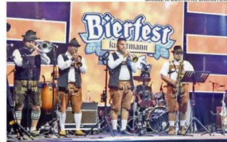
ESTE AÑO SE DESARROLLÓ LA VIGÉSIMOSEGUNDA EDICIÓN DEL EVENTO.

ción de su primera cerveza. Gracias al apoyo y la exigencia del Bierfest, Roselló pudo renovar su tecnología, pasando de equipos antiguos a consolas digitales y sistemas de iluminación de nivel internacional.