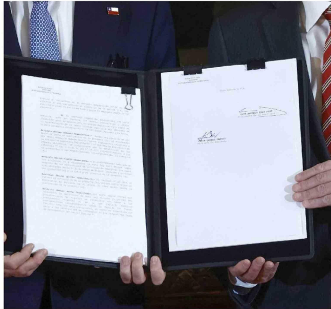
► El paquete de medidas es la piedra angular del proyecto del Ejecutivo.

El diputado Jaime Mulet, de la Federación