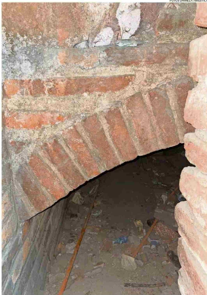
TÚNEL BAJO UN EDIFICIO DE SANTIAGO, EL PRIMERO QUE VISITÓ LA AUTORA.

La autora así llega al exCongreso, donde antes estuvo la Iglesia de la Compañía de Jesús, que a mediados del siglo XIX sufrió un incendio donde