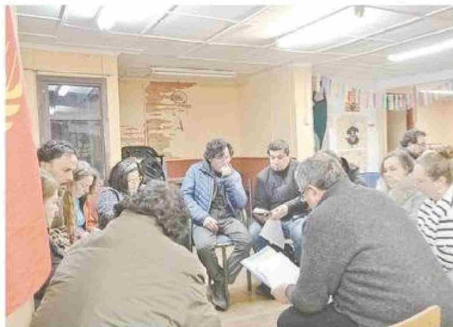
Los adherentes de Jara hicieron una jornada de trabajo programático para proponerle medidas a la candidata presidencial.