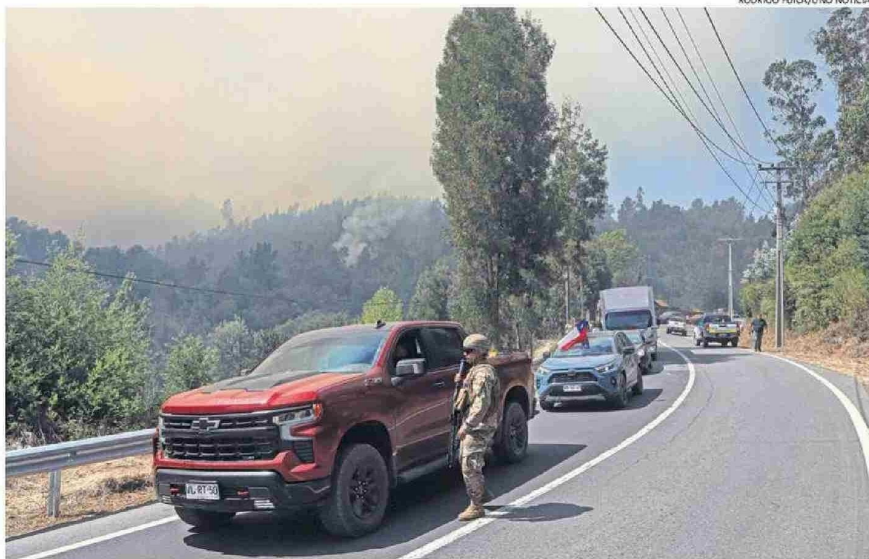
EL FUEGO AFECTABA AYER LOS SECTORES PUENTE 3, 4 Y 5 DE CONCEPCIÓN, DONDE HUBO EVACUACIONES.

En medio del combate, el Presidente Gabriel Boric visitó Concepción y Florida, donde dijo que dicho