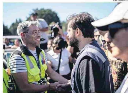
EL PRESIDENTE BORIC VISITÓ AYER LAS COMUNAS AFECTADAS.

En esa línea, y luego que se lanzaran piedras a voluntarios el martes en Angol, el Presidente Boric dijo que "cualquier agresión a Bomberos es absolutamente inaceptable. Las personas que agreden a Bomberos van a ser identificadas y castigadas".