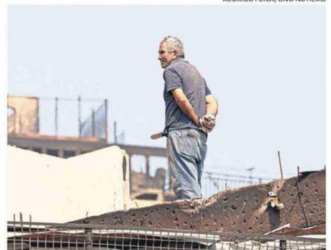
DESAZÓN TOTAL ENTRE LOS DAMNIFICADOS POR LAS LLAMAS.

rando y logramos reunirnos como familia. Los vehículos estaban explotando, si no fuera por los bomberos de Lota que nos ayudaron, es posible que no hubiésemos sobrevivido”, aseguró, añadiendo que “mientras esperábamos decían que iban a llegar los militares a ayudarnos a seguir evacuando, pero no apareció nadie. Estuvimos desde las 22 horas del sábado hasta las 5 de la mañana del domingo, y nadie aparecía. Hasta que llegaron otros bomberos a buscarnos y pudimos evacuar finalmente”.