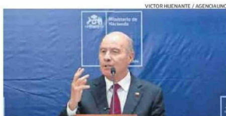
QUIROZ SUMÓ MEDIDAS A LAS ANUNCIADAS POR KAST.

Esto sorprendió porque antes el ministro Alvarado dijo en radio Cooperativa que no in-