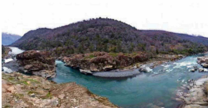
EMBALSE PUNILLA SE EMPLAZARÍA EN SAN FABIÁN DE ALICÓ, PRINCIPALMENTE.

estamos programando iniciar los trabajos en el segundo semestre con la primera tronadura.” Asimismo, se refirió a el Embalse Nueva Punilla donde destacó que “tenemos buenas noticias al respecto porque estamos prontamente a obtener la recomendación satisfactoria de ese proyecto, la que esperamos obtener en este primer semestre. De este modo nos podemos asegurar que po-