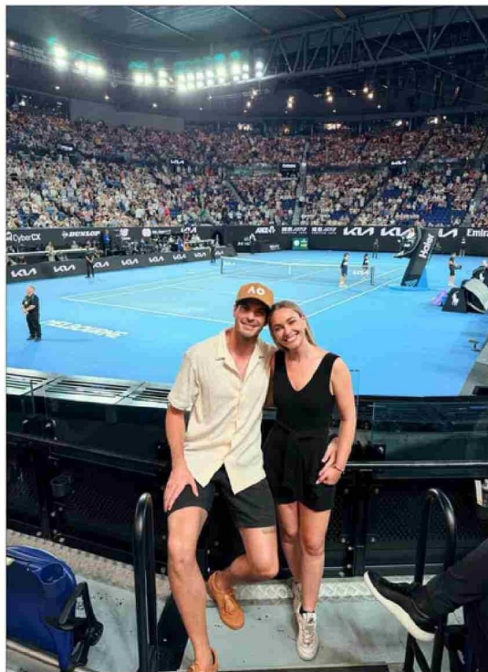
La actriz junto a su futuro marido.