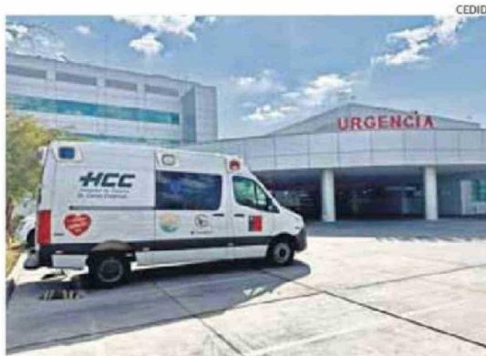
REFUERZAN LA UNIDAD DE URGENCIA PARA ENFRENTAR EL INVIERNO.