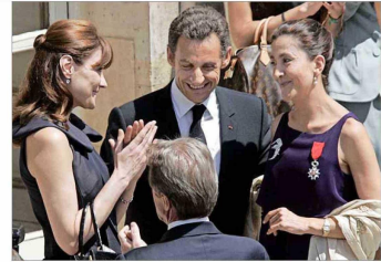
En 2008, Carla Bruni, el expresidente Nicolas Sarkozy e Ingrid Betancourt.