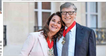
Melinda y Bill Gates, divorciados desde 2021, fueron condecorados en 2017.