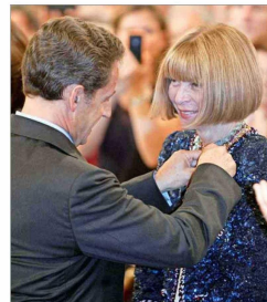
El expresidente Nicolas Sarkozy y la editora de Vogue, Anna Wintour, en 2011.

La amplitud de los ámbitos honrados por el gobierno francés a nivel internacional es notable y eso se ha visto en personajes condecorados como los que vemos a continuación.