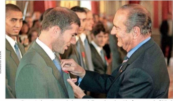
Durante la entrega de las medallas a la selección francesa de fútbol, tras ganar el Mundial de 1998.

2. La medalla de Caballero de la Legión de Honor tiene dos caras. Por un lado aparece la Marianne (como se aprecia en la imagen, al centro), la figura alegórica que representa a la República Francesa, y por el otro hay dos banderas francesas cruzadas.