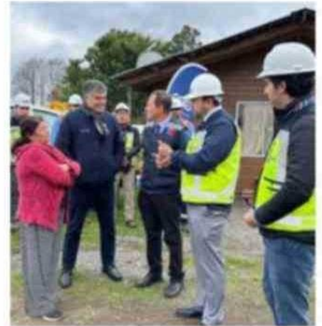
LAS AUTORIDADES ENTREGARON EQUIPO DE RESPALDO EN PLC.