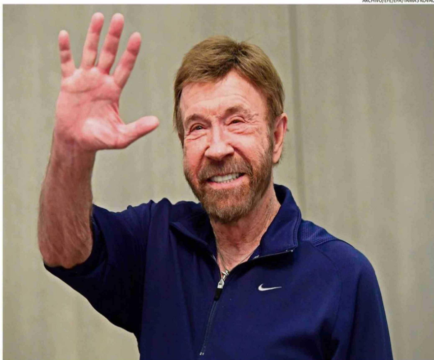
EL ACTOR FUE INTERNADO REPENTINAMENTE EN UN CENTRO MÉDICO EN HAWÁI. EL 10 DE MARZO HABÍA CELEBRADO SU CUMPLEAÑOS.

"Probé gimnasia y fútbol americano en la preparatoria North Torrance", le contó a The Associated