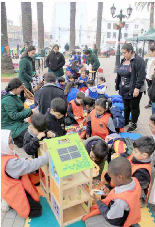
Durante toda la mañana, se desarrollaron actividades lúdicas en Plaza de Armas de Curicó.

CURICÓ. Los beneficios del juego para los niños fue el tema central de la jornada que realizó la Escuela de Educación Parvularia de la Universidad Católica del Maule (UCM) en Plaza de Armas de Curicó.