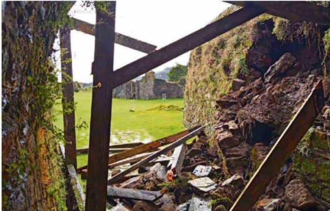
BIENES NACIONALES ES EL ADMINISTRADOR DEL ESPACIO QUE CORRAL PIDE EN CONCESIÓN.

de inicio de un trabajo colaborativo más estrecho entre la Municipalidad de Corral y la APC Región de Los Ríos, que se materializó en un convenio firmado este año.