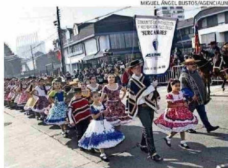
CONJUNTO FOLCLÓRICO "SURCAMARES" FUE PARTE DEL ACTO AYER.