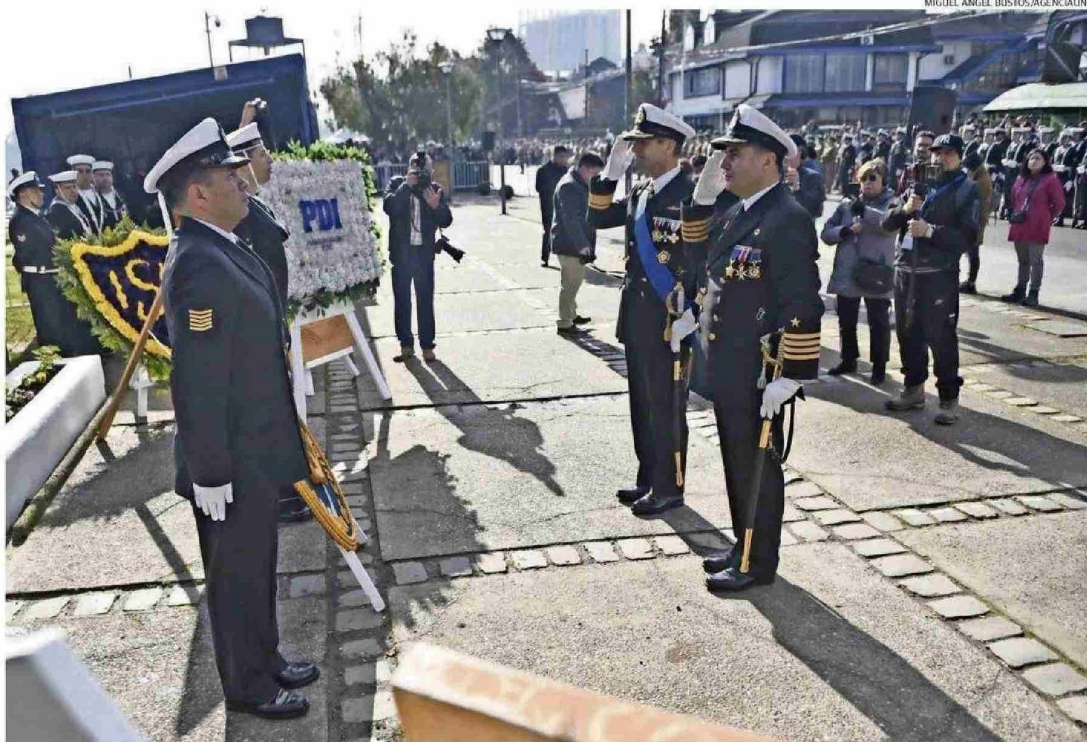
EN LA COSTANERA DE VALDIVIA, FRENTE AL BUSTO DEL CAPITÁN ARTURO PRAT, SE REALIZÓ AYER EL HOMENAJE A LAS GLORIAS NAVALES.

"No es una rutina ni una costumbre vacía, es el eco profundo de una promesa renovada: la de honrar a quienes, con valentía sin medida, defendie-