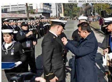
ENTREGARON CONDECORACIONES POR 30 AÑOS DE SERVICIO.