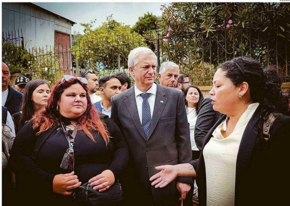
RESIDENTES Y DIRIGENTES VECINALES EXPRESARON SUS INQUIETUDES FRENTE A LA "INEXISTENTE" RECUPERACIÓN DE SUS VIVIENDAS.

No obstante, el próximo representante de la cartera de vivienda, Iván Poduje fue categórico en señalar que las cerca de 400 casas entregadas solo representan un 10% de progreso en el programa, además de existir alrede-