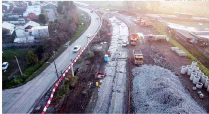
EN LA IMAGEN SE APRECIA EL AVANCE DE LAS OBRAS DE LA DOBLE VÍA EN EL ACCESO NORTE POR PILAUICO.

considera el primer tramo desde la Ruta 5 hasta calle Bulnes, donde se concretará la ampliación a una doble calzada, con ciclovia, entre otros elementos.