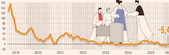
CRECIMIENTO ANUAL DE LA POBLACIÓN VENEZOLANA EN EDAD DE TRABAJAR EN CHILE PORCENTAJE - DATOS TRIMESTRALES