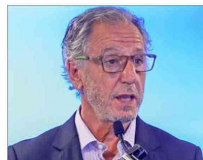
Álvaro García, biministro de Economía y Energía.