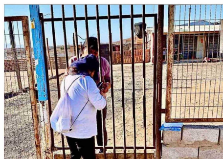
La toma denominada Cuatro Palomas no ha logrado ser contenida por las autoridades de sucesivos gobiernos, tras surgir en 2009.

vierte que "estamos prácticamente ante la presencia de un nuevo Alto Hospicio y también para nosotros se nos torna complejo responder a las distintas necesidades que se generan ahí".