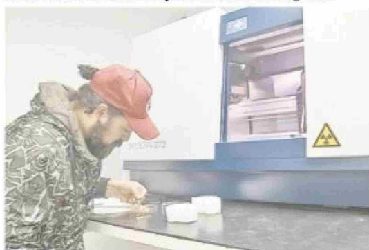
Plataforma de Secuenciación Genética de tercera generación.