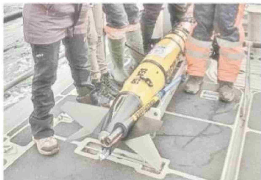
Glider submarino autónomo para monitoreo oceanográfico.

Este vehículo submarino no tripulado es capaz de operar hasta los mil metros de profundidad, realizando ciclos continuos de ascenso y descenso durante períodos que pueden extenderse entre uno y tres meses. Su despliegue desde embarcaciones menores, incluso en condiciones adversas