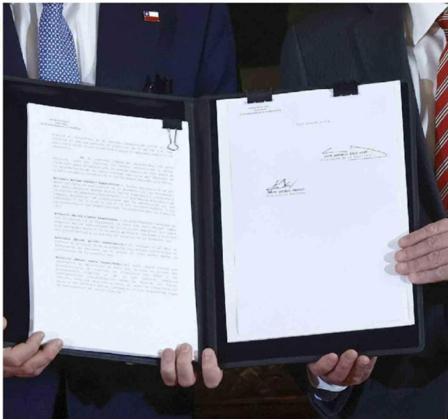
► El paquete de medidas es la piedra angular del proyecto del Ejecutivo.