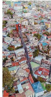
"UN PUENTE ENTRE EL MAR Y EL CERRO", DE PABLO TRINCADO.

ra lo mejor posible la esencia del concurso".