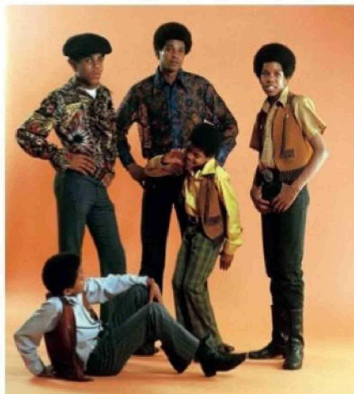
Los hermanos Prince, Paris y Bigi Jackson han mantenido viva la memoria de su padre a través de apariciones públicas y homenajes.

ocultar la verdad, alimentando una sensación de amenaza constante.