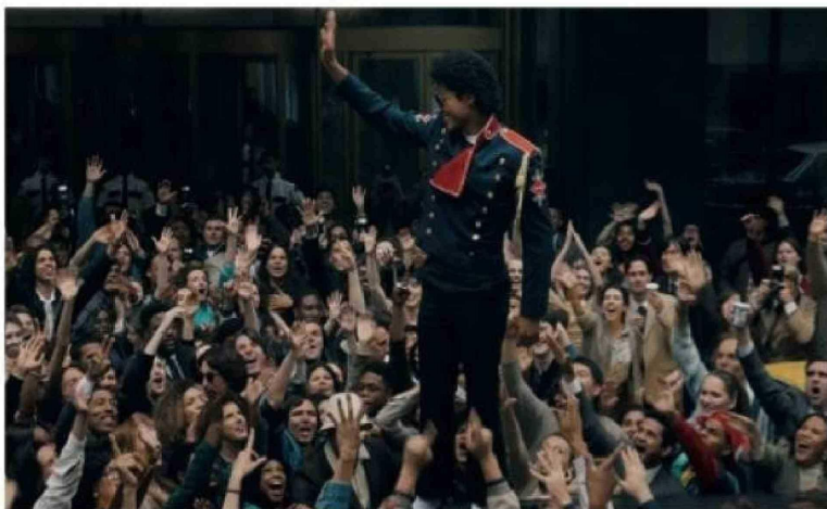
Michael Jackson ha logrado un repunte en su popularidad gracias a su nueva película biográfica.

bamos a más cosas, como besos, sexo oral, y él me decía que eso era un vínculo especial que teníamos y me decía cosas como: 'Sólo hago esto contigo', o 'Te quiero muchísimo'. Y hacía muchas cosas para demostrármelo. Ya sabes, algunas de las cosas que hacía eran... bebía mi orina y me decía: 'Esto es lo mucho que te quiero'".