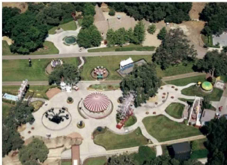
En Neverland, Michael Jackson organizó eventos benéficos y recibió a miles de niños y admiradores de todo el mundo.