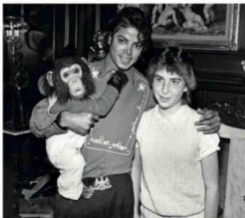
Michael Jackson con su chimpancé "Bubbles" y una fan.