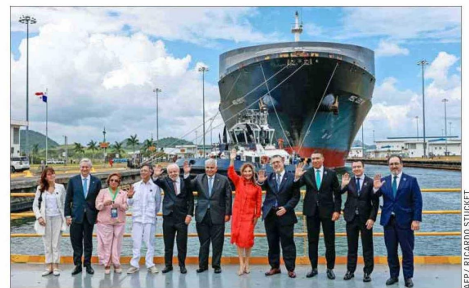
Durante su estadía en Panamá, Kast coincidió con autoridades regionales, como Gustavo Petro, Lula da Silva y Daniel Noboa.

*Asumió de facto tras la captura de Nicolás Maduro por parte de Estados Unidos. Aún no se anuncia un cronograma electoral. **Asumió en octubre de 2025 para terminar el período presidencial.