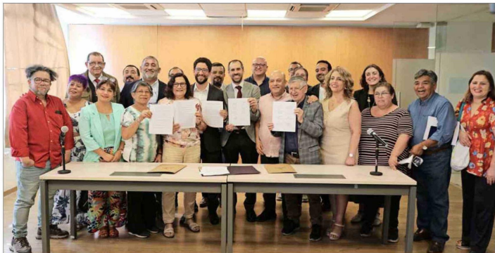
La semana pasada se firmó el acuerdo entre el Gobierno y las organizaciones, el cual incluyó las cláusulas de "amarre".

Horizontal estima que serían unos 201.712 empleados a contrata los que quedarían "amarrados" a sus puestos. De ese grupo, unos 91 mil tienen una renta bruta superior a los $2,5 millones mensuales.