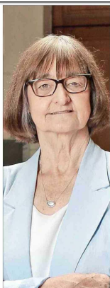
La rectora de la U. de Chile y bioquímica, Rosa Devés.