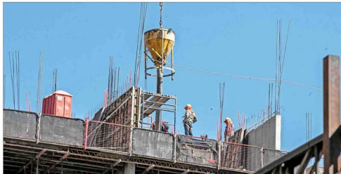
El crecimiento aparece como una de las prioridades, para evitar el descontento de la ciudadanía.

Tiraje: 126.654 Lectoría: 320.543 Favorabilidad: Positiva