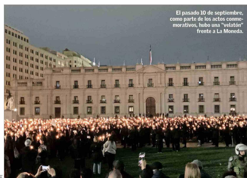
El pasado 10 de septiembre, como parte de los actos conmemorativos, hubo una "velación" frente a la Moneda.