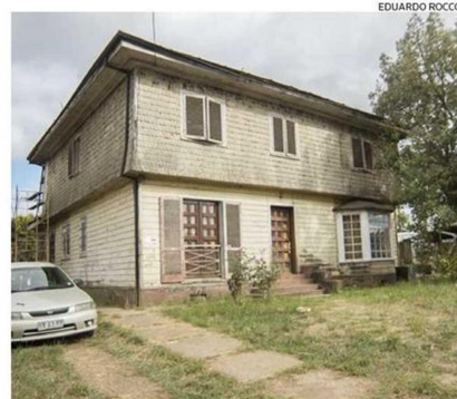
EN 2019 BIENES NACIONALES TRASPASÓ EL INMUEBLE AL CPCV.

Edificado y Contexto, que fue crucial en la formulación de la propuesta presentada al fondo