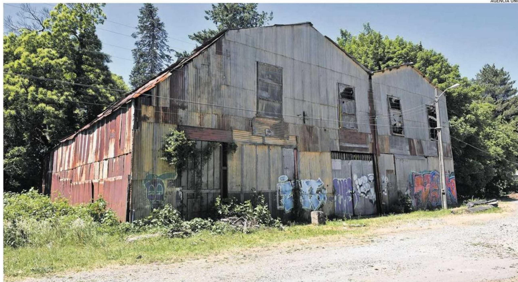
LA LEÑERA DATA DEL SIGLO XIX, FUE UNA DE LAS INSTALACIONES DE LA EX CERVECERÍA ANWANDTER DESTRUIDA EN 1960 POR EL TERREMOTO.

En la Línea de Proyectos de construcción y/o habilitación