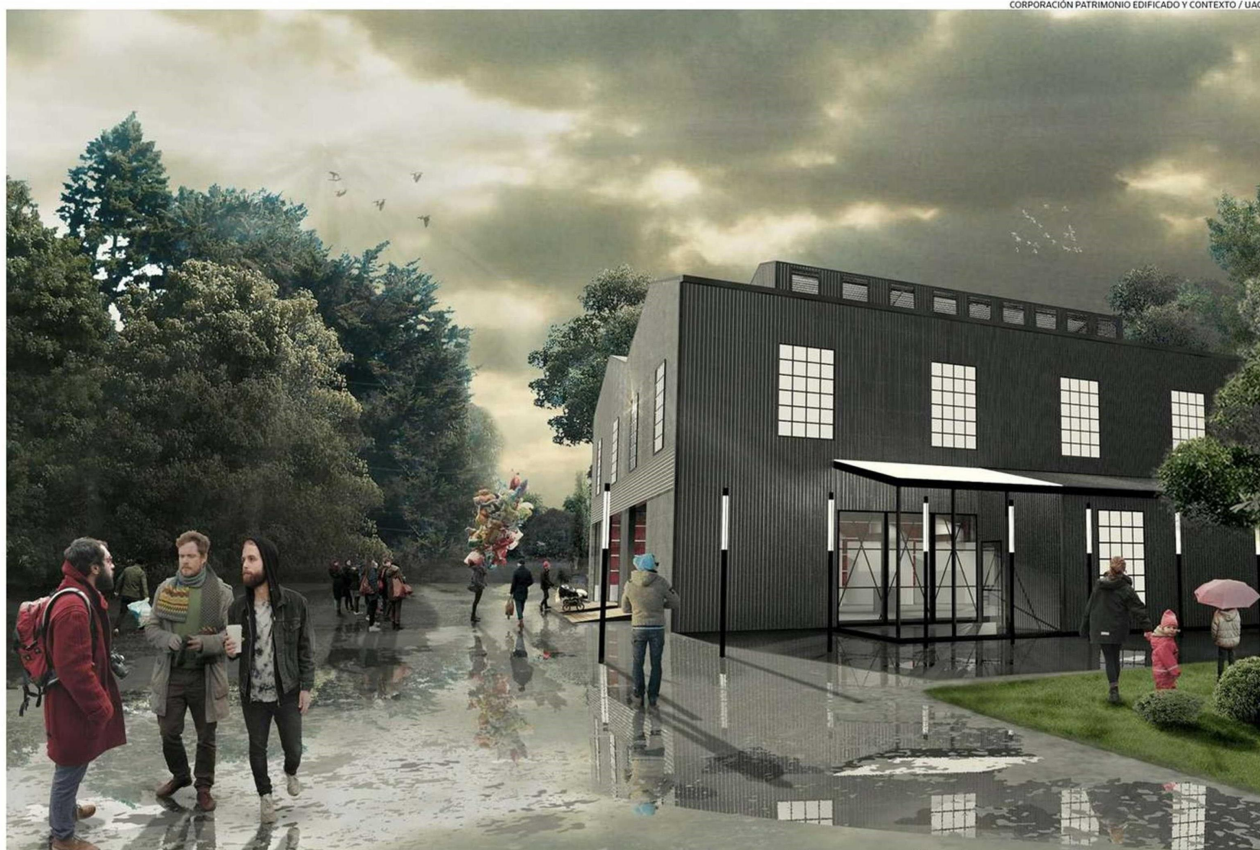
LA CREACIÓN DEL ESPACIO CULTURAL COMUNITARIO DE LA UACH ESTÁ PENSADO EN VARIAS ETAPAS, LA PRIMERA DE ELLAS SE COMENZARÁ A EJECUTAR EL PRÓXIMO AÑO.

La Universidad Austral de Chile y el Centro de Promoción Cinematográfica de Valdivia ganaron fondos del Ministerio de las Culturas para la intervención y diseño arquitectónico de dos inmuebles con alto valor patrimonial.