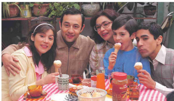
Familia. Los Herrera se convirtieron en un fenómeno en la tv.

Horario prime. La exitosa serie se retransmitirá los días lunes y martes después de "Teletrece Central".