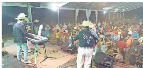
La Fiesta del Chivo ya va por su octava versión oficial en la comuna de Quilaco.

Dicha festividad representa un impulso para las actividades de verano y las características propias de la ciudad. Para estos tres días se espera volver a traer el denominado "Desafío del kuchen", una hilera de pasteles en donde los visitantes puedan degustar. El año pasado se llegó a los 40 metros, meta que en esta versión deberá ser superada.