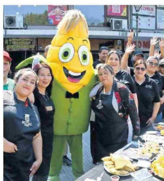
"Choclin", símbolo inconfundible de la fiesta, y emprendedores.

La próxima trilla a yegua suelta se desarrollará en el sector de San Lorenzo, el día 24 de enero. El 25, en tanto, la trilla será a máquina.